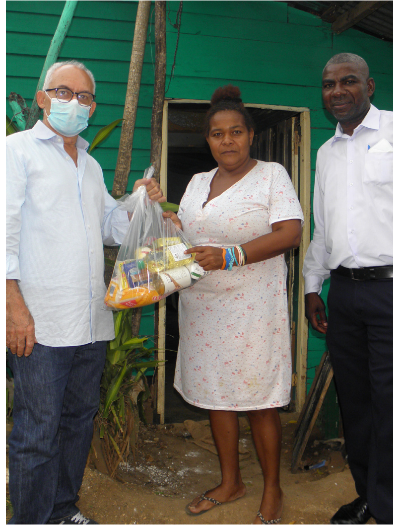
La Fundacion Sueños Realizados (FUSURE) entregó totalmente remodelada una vivienda a la familia Fajardo residente en Punta Villa y entregó raciones alimenticias a moradores de Mata Los Indios, ambos en Villa Mella, Santo Domingo Norte.